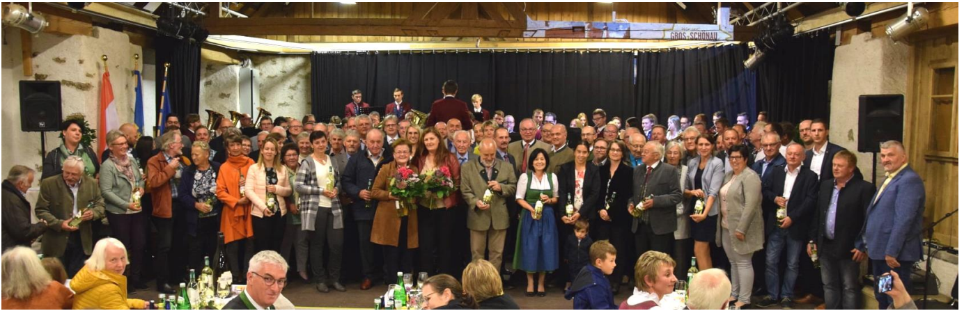
Am Bild unsere tragenden Säulen wie z.B. Feuerwehrkommandanten, Vereinsobleute, Gemeinderäte

Vor 50 Jahren haben sich die vier Gemeinden Mistelbach, Großotten, Friedreichs und Großschönau zusammengetan, mit mehr oder weniger Freude daran.